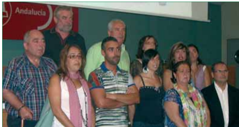
Foto de grupo de los representantes de la Plataforma.

reivindica la democracia, la prevalencia de los poderes públicos legítima y democráticamente elegidos sobre los poderes financieros, una economía productiva socialmente responsable y la capacidad reivindicativa y asociativa ciudadana para salvaguardar los derechos sociales adquiridos.