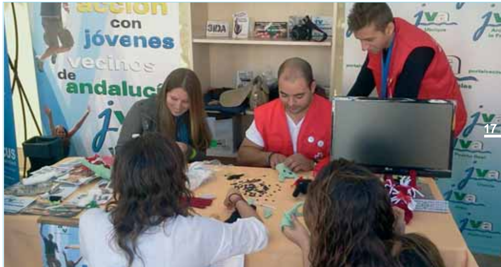
Actividades en el stand de Jóvenes Vecinales.

Junto a estas actividades, el Ágora contó con la Feria de la Juventud, en la que Jóvenes Vecinales de Andalucía dieron a conocer en un stand las actividades que desarrollan en los grupos existentes en las federaciones, como la Escuela de Formación.