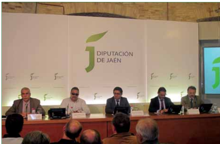
Mesa constitutiva de la Unión Provincial de AA.VV de Jaén.

En su intervención, el presidente de la Diputación mostró su satisfacción por la constitución de este movimiento vecinal, algo “clave en cualquier sociedad democrática, ya que es muy importante que los vecinos y vecinas estén organizados y cuenten con un instrumento que permita el contacto permanente con las diferentes administraciones”. En este sentido, Francisco Reyes remarcó su apoyo a esta Unión Provincial que “aunque de mo-