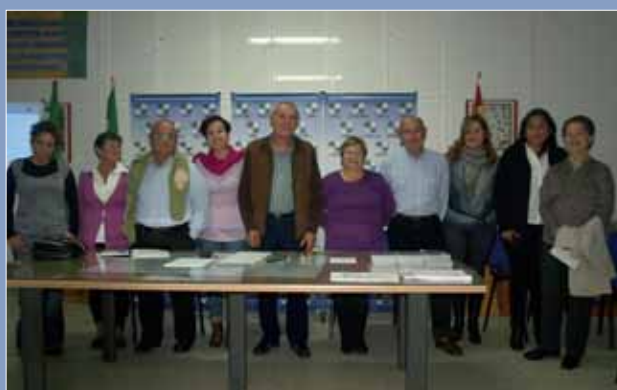
Nueva directiva de la Federación “Sol y Mar”.