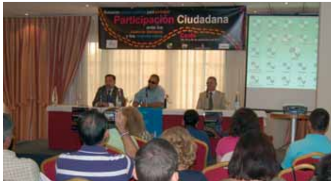
Momento de las Jornadas.