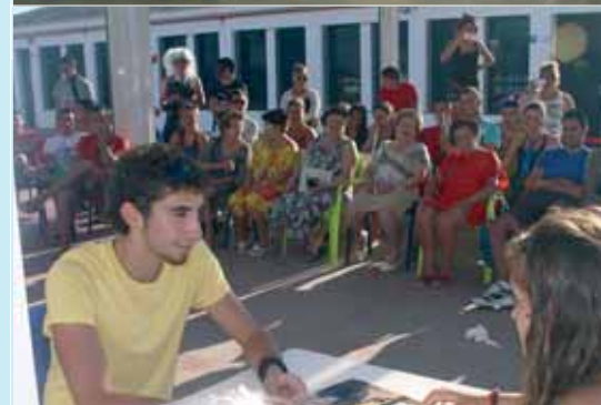
Dos momentos de la Escuela de Formación.