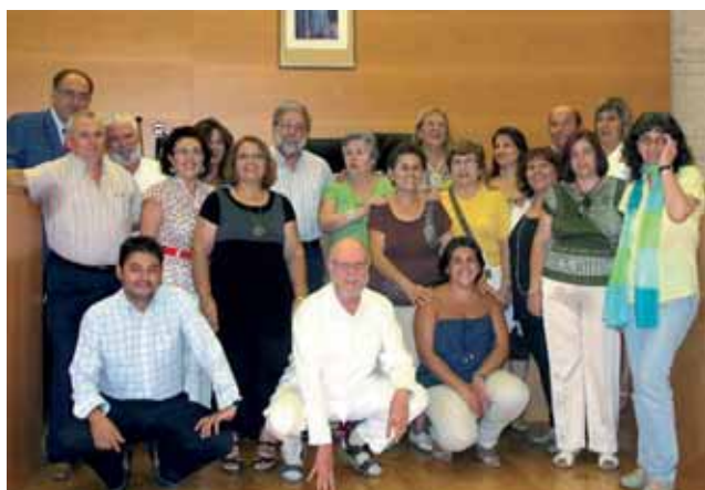
Firmantes del Pacto Local por la Conciliación.