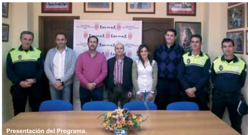
Presentación del Programa.

Igualmente, el Programa, que se prolongará hasta el próximo mes de marzo, contempla la creación