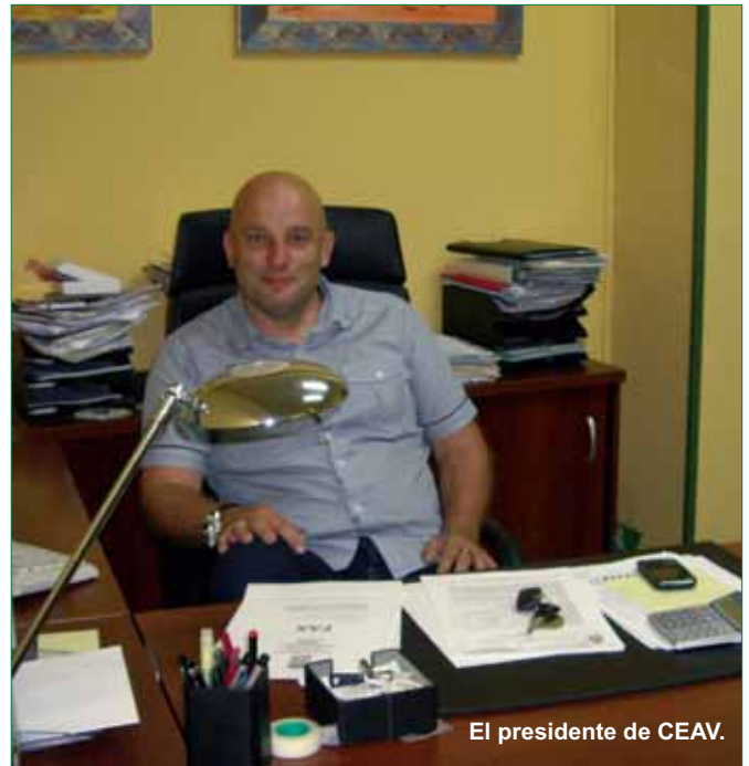
El presidente de CEA.V.

En estos tiempos, con una aguda crisis económica y social, las personas de nuestros barrios deben vernos más cercanos que nunca en nuestro esfuerzo para intentar solucionar sus problemas más acuciantes, pero a la vez las administraciones deberían tener en cuenta que somos un punto de apoyo muy cercano que llega directamente a la calle, y que está inmerso dentro de ella. Por ello podemos y estamos dispuestos a colaborar en cualquier actuación o programa que se desarrolle, pudiendo facilitar su proximidad al vecindario, a la vez que, seguro, facilitando una menor inversión económica que las realizadas hasta estos momentos.