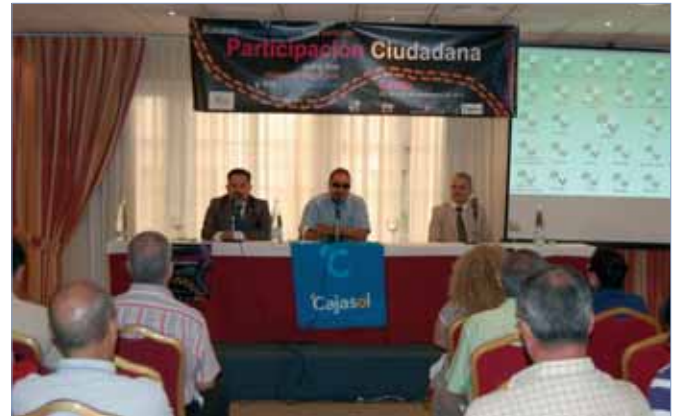
Durante dos días Ceuta fue centro de debate.