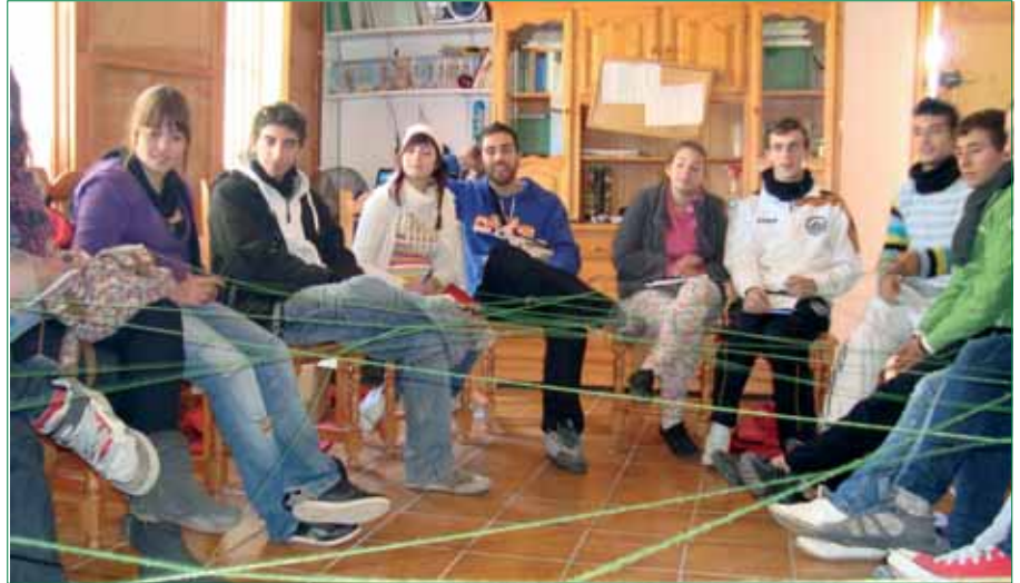
Dinámica grupal con escenificación de trabajo en red.

El movimiento vecinal andaluz desea que el paquete de medidas propuesto por el nuevo gobierno ayude a la sociedad seriamente afectada por el desempleo, a salir de la grave crisis económica, pero sin menoscabar la participación ciudadana. Asimismo, confía en que la diferencia de "color político" de los gobiernos nacional y regional, no sea un hándicap añadido a la puesta en marcha de programas de actuación en los barrios y municipios andaluces.