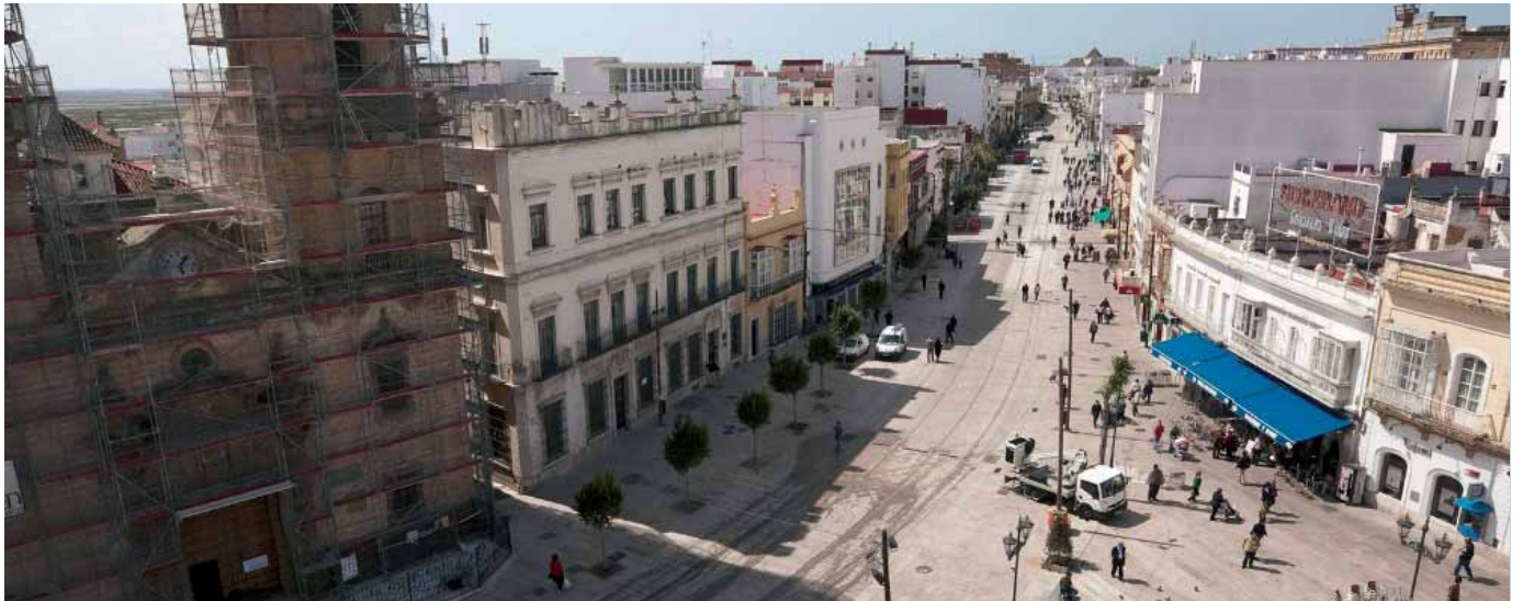
Estado de la Calle Real por las obras del tranvía.