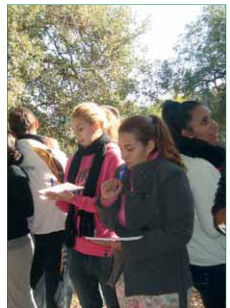
Actividades en la naturaleza.

Igualmente, desde el movimiento vecinal se trabaja por que los más jóvenes cuenten con las pautas necesarias para poder elaborar y desarrollar una propuesta o programa de Educación en valores desde cualquier ámbito de intervención social, al tiempo que se fortalezcan sus capacidades como agentes para la transformación social.